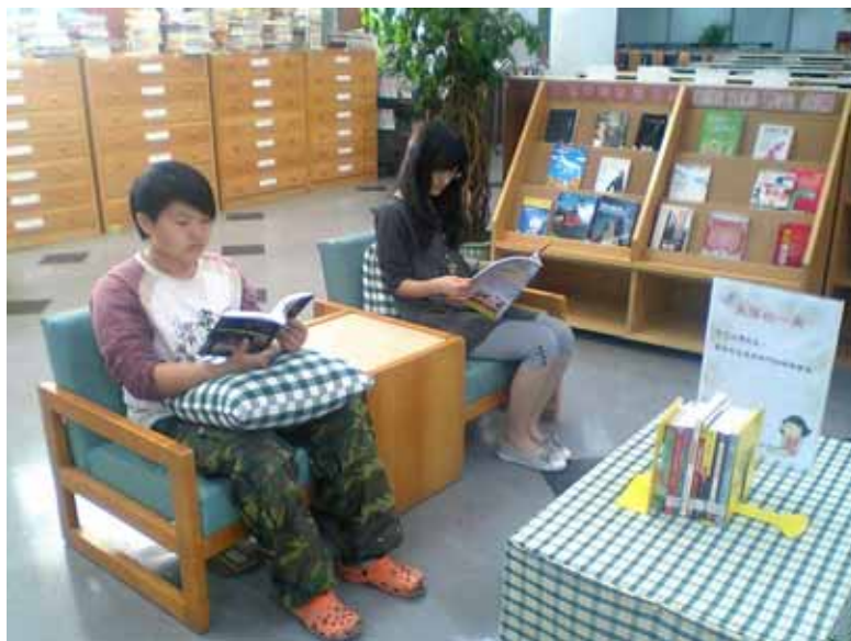
(圖四:失落的一角活動實況)

圖書館於每星期三，替讀者挑選好書，將過去曾經熱門一時的暢銷館藏，放置在一樓，新到資料旁的休憩桌，供讀者借閱。目前雖然只有一半的書被借閱及翻閱，但圖書館依然會做好心靈導航員的角色，提供讀者一隅，找尋失落的好書，畢竟好書永遠值得再次推薦、品嚐。