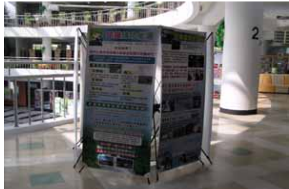
(圖：六樓暖化書展系列海報展)