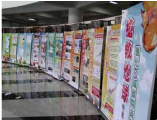
(圖：五樓暖化系列海報展)