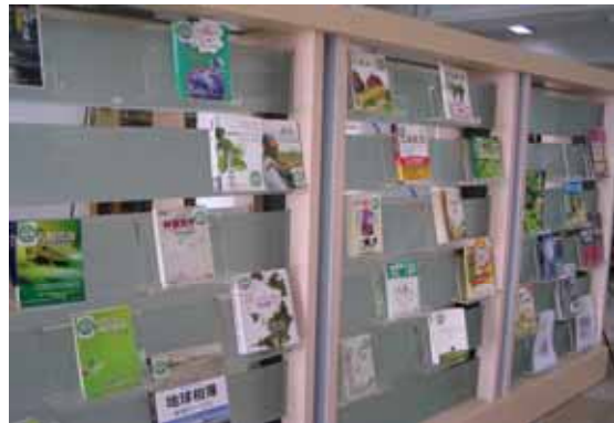
(圖八：二樓暖化系列書展)