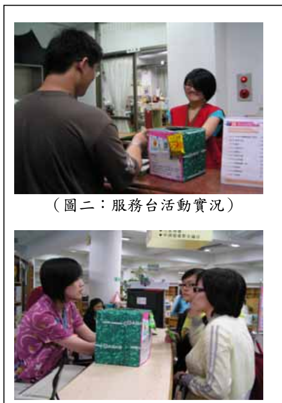
(圖二：服務台活動實況)